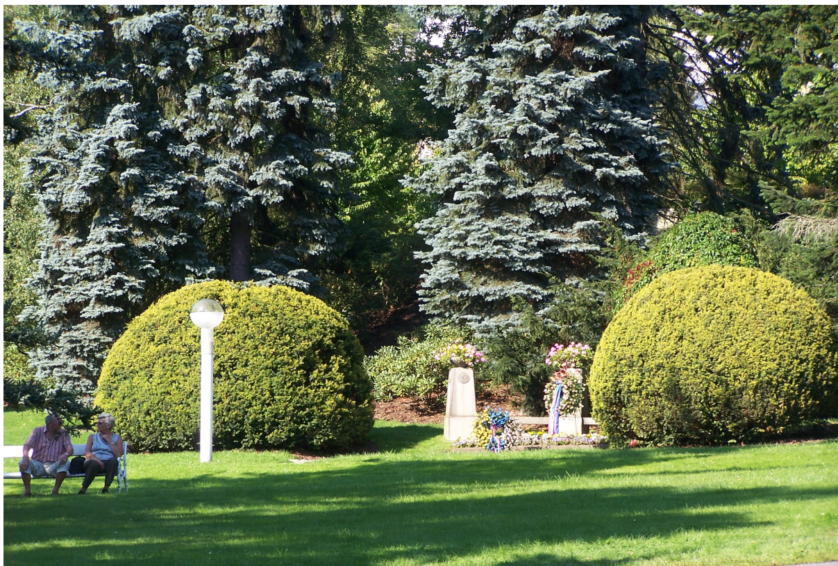
POHLED NA ČÁST PLOCHY U CHOPINOVO PAMÁTNÍKU. ZA PAMÁTNÍKEM BUDOU ČÁSTEČNĚ REDUKOVÁNY VYSOKÉ KEŘE, ČÁST JEHLIČNATÉHO POROSTU A OBNOVEN PRŮHLED NA RUDOLFŮV PAVILON, KOSTEL NAD NÍM A ZPĚTNĚ POHLED DO PARKU Z VYVÝŠENÉ TERASY PROMĚNÁDY.