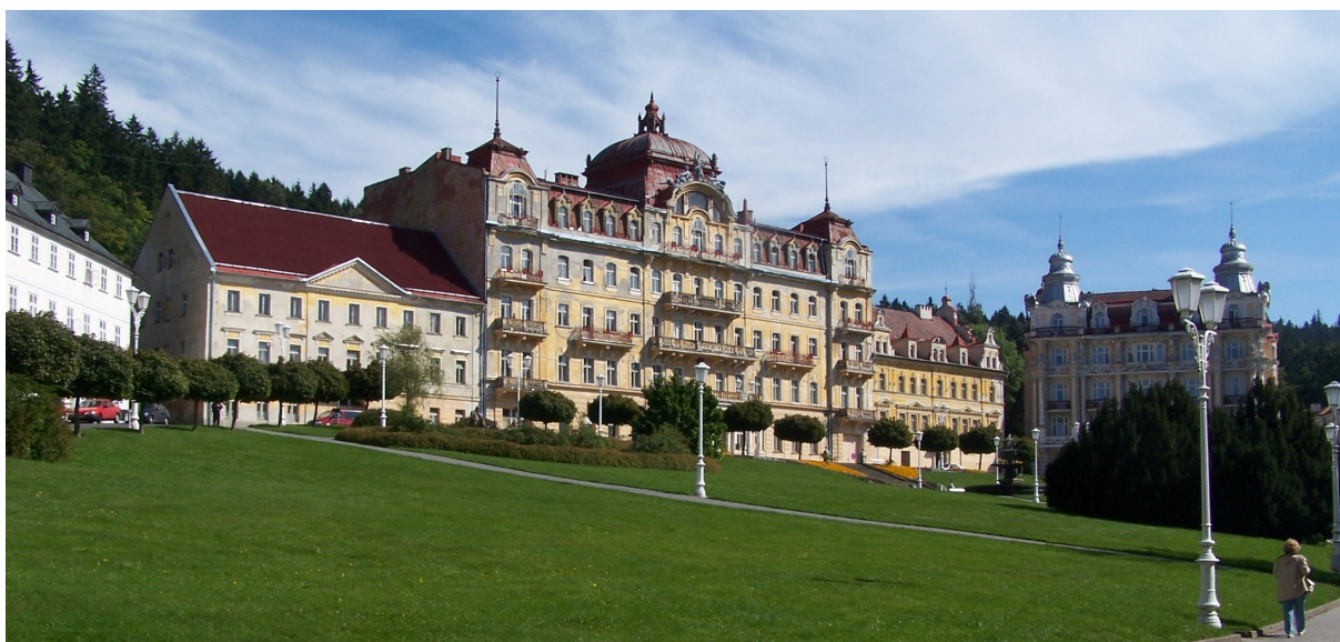
PANORAMATICKÝ POHLED NA GOETHOVO NÁMĚSTÍ. V HORNÍ ČÁSTI BUDOU LETNÍČKOVÉ ZÁHONY NAHRAŽENY POKRYVNÝMI DŘEVINAMI, PŘEVÁŽNĚ RŮŽEMI, V LEVÉ ČÁSTI BUDOU TAKÉ DOPLNĚNY RŮŽE.