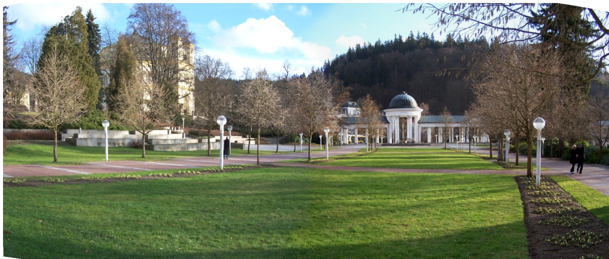
PANORAMATICKÝ POHLED NA PROMENÁDNÍ PROSTOR, JEHOŽ SOUČÁSTÍ JSOU NEÚPLNÁ A STÁLE DOSAZOVANÁ STROMOŘADÍ. V PROJEKTU JE NAVRŽENA OBNOVA STROMOŘADÍ V LEVÉ ČÁSTI, STŘEDOVÉ NEÚPLNÉ K ODSTRANĚNÍ, PRAVOSTRANNÁ ŘADA (MIMO OKRAJ SNÍMKU BUDE ZACHOVANÁ)