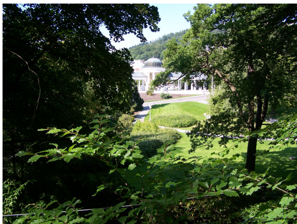
NA SNÍMCÍCH NĚKTERÉ ILUSTRATIVNÍ ZÁBĚRY ZARŮSTAJÍCÍCH POHLEDŮ NA DOMINANTY MARIÁNSKÝCH LÁZNÍ. NUTNÉ PROSVĚTLENÍ, VYVĚTVENÍ SPODNÍCH ČÁSTÍ KORUN NEBO PŘÍPADNĚ ODSTRANĚNÍ NĚKTERÝCH DŘEVIN.