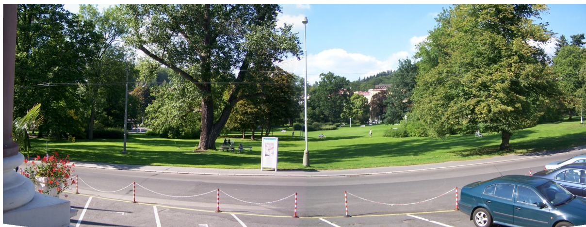
PANORAMATICKÝ POHLED NA CENTRÁLNÍ ČÁST SKALNÍKOVÝCH SADŮ, KDE JE NEJVĚTŠÍ POČET OŠETŘOVANÝCH DŘEVIN.