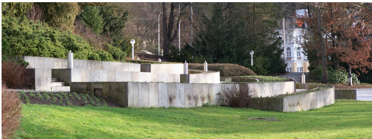
PANORAMATICKÝ POHLED NA VYVÝŠENÉ BETONOVÉ ZÁHONY S LETNÍČKAMI A DVOULETKAMI. KASKÁDY JSOU NAVRŽENÉ KE ZRUŠENÍ S VYTVOŘENÍM PŮVODNÍ TERÉNNÍ MODELACE SVAHU.