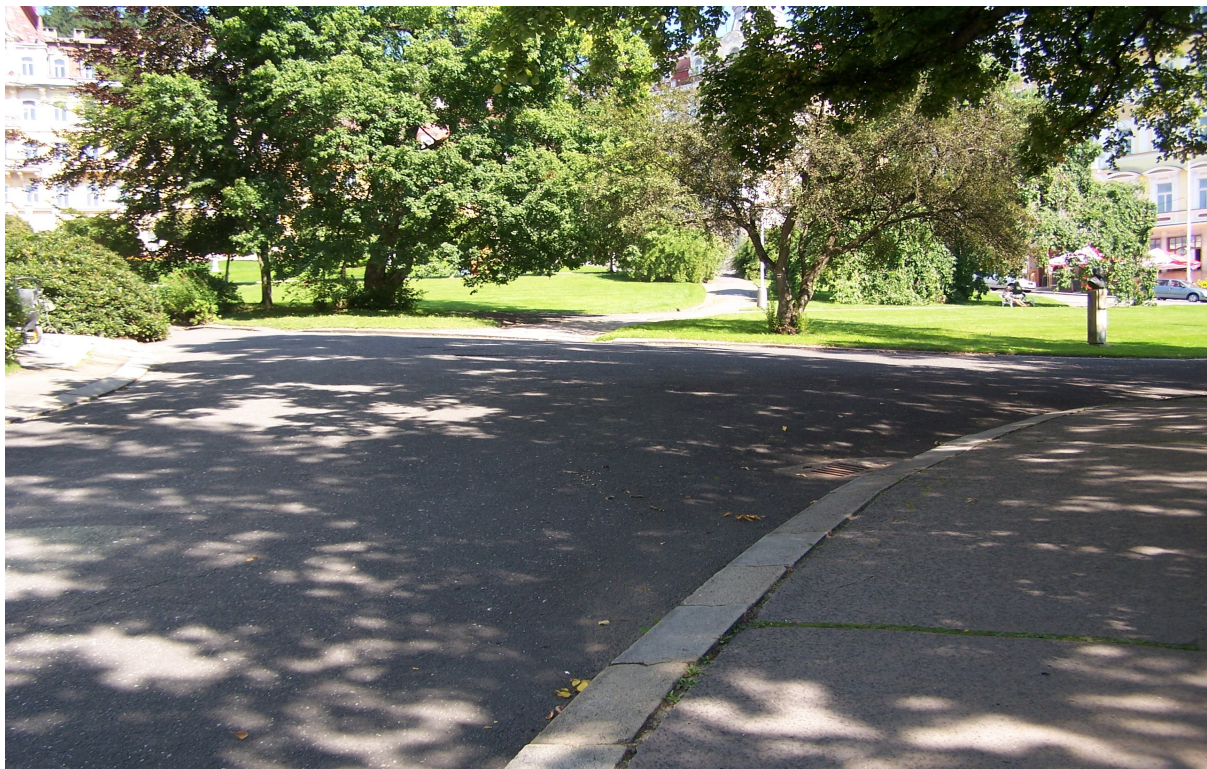
POHLED NA ASFALTOVÉ PLOCHY VEDLE KOSTELA, U KTERÝCH BUDE REDUKOVÁNA JEJICH PLOCHA A ZVĚTŠENA VEGETAČNÍ PLOCHA PARKU SE ZATRAVNĚNÍM.