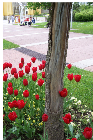
DETAILY KMENŮ LÍSEK TURECKÝCH ( CORYLUS COLUMNA ) V PROMENÁDNÍM PROSTORU POŠKOZOVANÝCH MRAZOVÝMI TRHLINAMI.